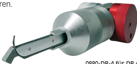
0880-DB-4 für DB 4-Bahnensysteme

Die Werkzeuge lesen die Tiefe von den Scheiben der 2- u. 4-Bahnensysteme schnell aus und ermöglichen es, passende und mechanisch korrekt arbeitende Schlüssel zu produzieren.